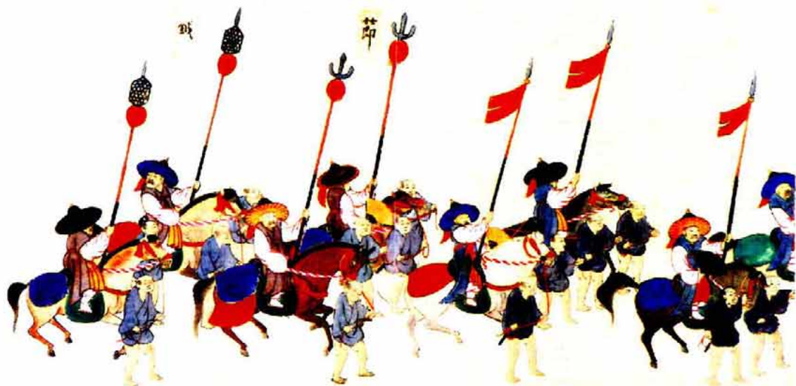
●朝鮮通信使絵巻・部分 紙本墨彩 制作年不詳 長崎県立対馬歴史民俗資料館蔵 これは部分であるが、本来は全長16.58m、幅27cmの巻物である

豊臣秀吉の朝鮮侵略以来、断絶していた李王朝との交流は、対馬藩の懸命の努力が実りようやく回復し、慶長12年（1607年）から文化8年（1811年）までの204年間に12回の通信使が海を渡っている。一行は国書を携えた正使以下400～500名で組織され、多くは