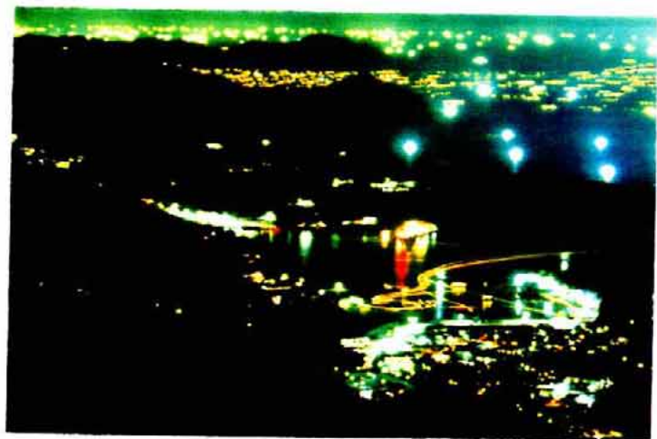
（厳原港付近の漁火）

生産力の低い対馬にとっては朝鮮貿易はまさに生命線であり悠久の昔から現在まで厳原港は要衝としての位置を保っている。