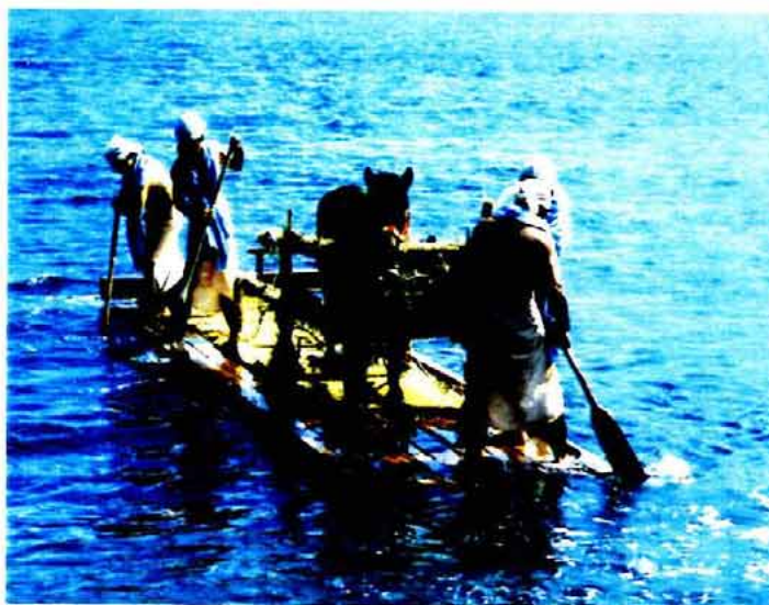
(対馬の古い作業舟「藻刈舟」)