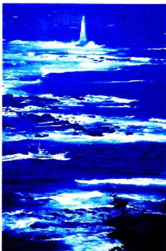
(対馬最南端「豆殻崎」)