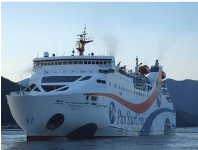
韓国のクルーズ客船「パンスター・ハニー」

観光客は同埠頭で市民グループによるキムチをトッピングした肉じゃがの振る舞いを受けた後、舞鶴市内や宮津市の天橋立などの観光を楽しみ、夜には、釜山への帰路に着きました。