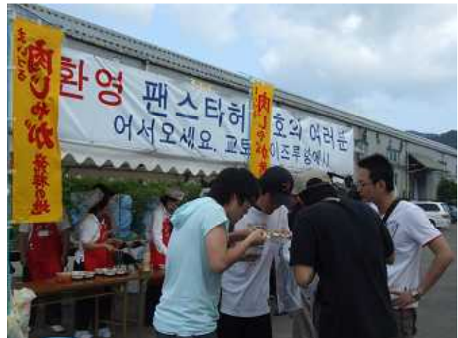
キムチをトッピングした肉じゃがをほおぼる観光客