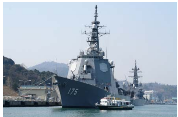
自衛艦の迫力が間近に見える