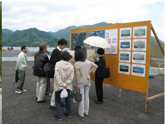
ふ頭の説明を熱心に聴く参加者