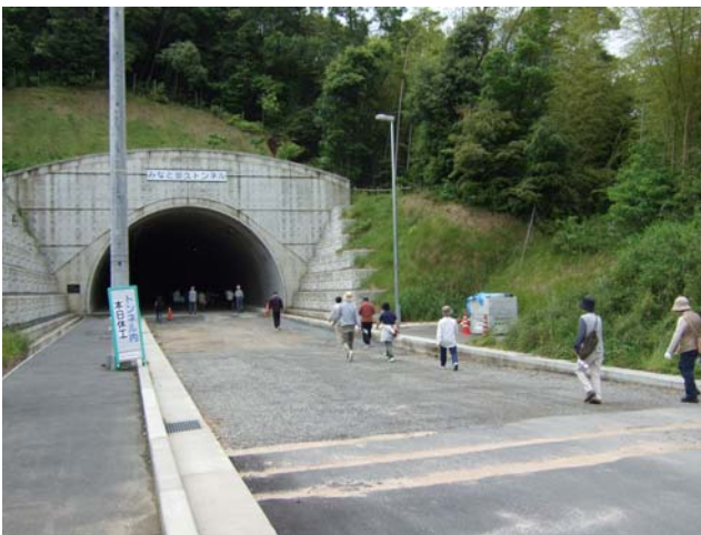
臨港道路をウォーキング中

これからも、港湾施設の整備はもちろんのこと、港湾振興の観点からも関係機関と一丸となって舞鶴港の発展のための取り組みを進めて参ります。