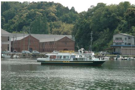
赤れんが倉庫群を眺めながら