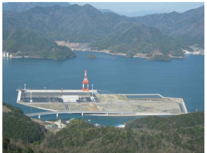
舞鶴国際ふ頭の現況 (H22. 2月)