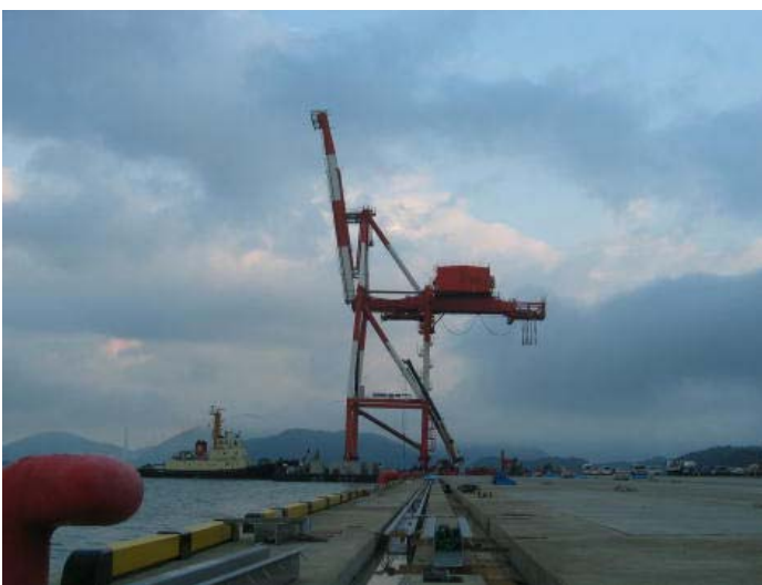
ガントリークレーン移設状況 (H21. 11月)

日本海側最大級となる多目的国際ターミナル「舞鶴国際ふ頭」が平成22年4月、いよいよ供用を迎えます。近畿圏で日本海側唯一の重要港湾である京都舞鶴港では、1989年からコンテナ貨物の取り扱いを行っています。経済発展が著しい北東アジア諸国、そして世界との物流・人流の拠点として、また関西経済圏の日本海側の窓口としての役割を担う国際港湾を目指して、平成3年度から多目的国際ターミナル「舞鶴国際ふ頭」の整備を進めてきました。水深-14mの大水深岸壁には、5万トン級の大型船舶の接岸が可能になります。供用に先立って、平成22年3月14日にふ頭内で完成式典を開催します。式典ではテープカット、くす玉開き、ガントリークレーン試運転などを予定しており、合わせて、地元の皆さんが中心になって企画する府民参画イベントや地元物産展なども同時開催される予定です。