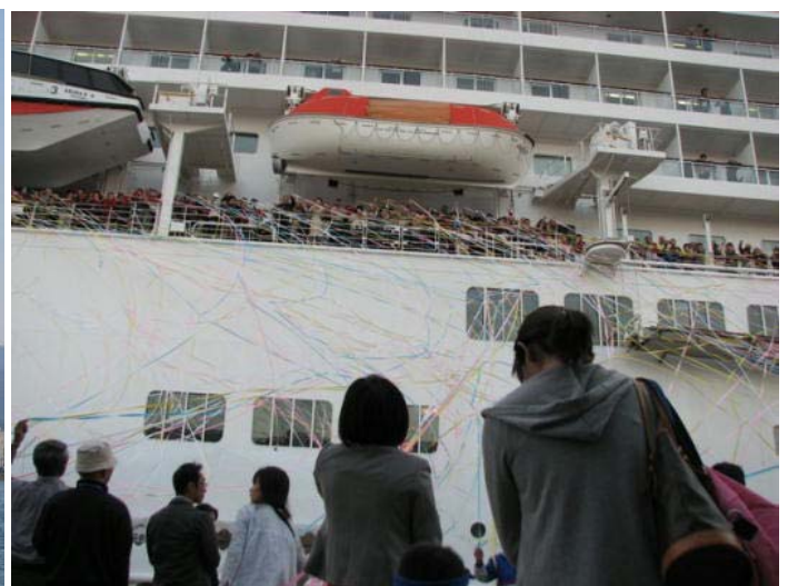
見送りセレモニー