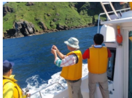
クルージング風景