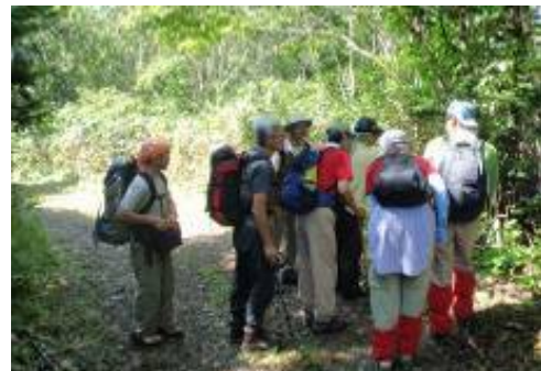
トレッキング風景（ガイド付き）