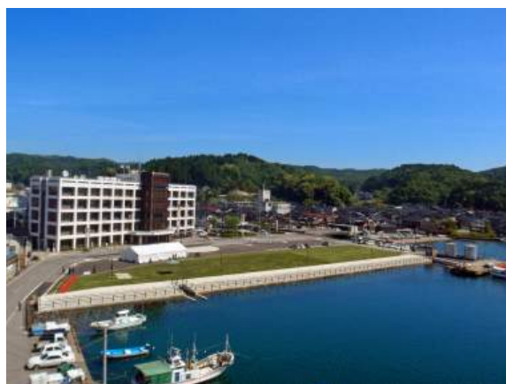
宇出津港いやさか広場（式典会場）全景

広場の名称は公募により「宇出津港いやさか広場」に決定し、ますます栄えてほしいという願いが込められています。