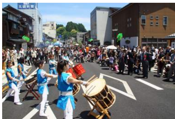
イベント会場での太鼓披露