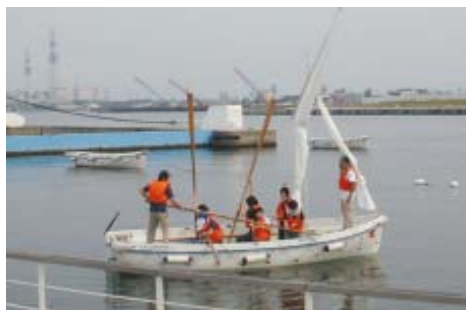
カッターセイリング教室

19日には海王丸総帆展帆をはじめ、年に1度だけの登檣礼(とうしょうれい)・汽笛吹鳴が行われます。