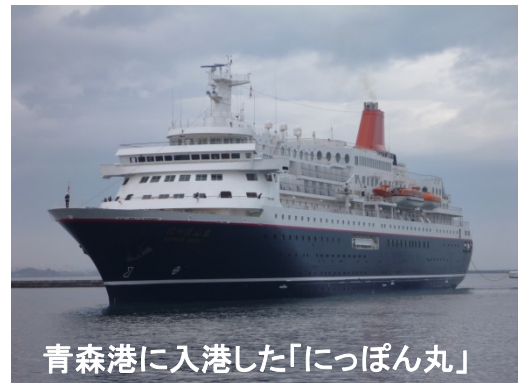
青森港に入港した「にっぽん丸」

これから、本格的なクルーズシーズンが到来します。12月には東北新幹線が新青森駅まで全線開業します。クルーズ客船の誘致活動を通じて、さらに多くの人に青森や青森港の魅力をPRできればと考えております。