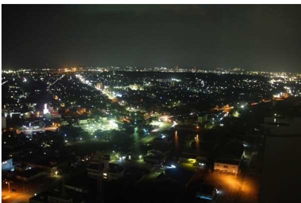
「セリオン」からの夜景

さらに9月、収穫の季節に入っからは、オシャレな市場「マルシェ de ポート土崎」が立ち、地元で採れた野菜や新鮮な魚が並びます。秋田にいらした際はぜひお立ち寄りください。