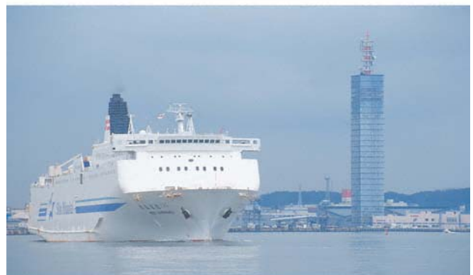
フェリーとポートタワー「セリオン」

また同じ敷地内に、一年をとおして森林浴を楽しめるセリオンリスタ、体育館や大広間を備えたセリオンプラザ、屋外のイベント広場があり、これらの施設を有機的に結びつけることで、ほかには無い魅力を発揮する道の駅となりました。