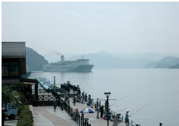
出航する「はまなす」〔親海公園沖〕

また、エントランスでは丹後・舞鶴の特産品や土産物の販売、船長スタイルでの記念撮影会が開催され、好評を博しておりました。