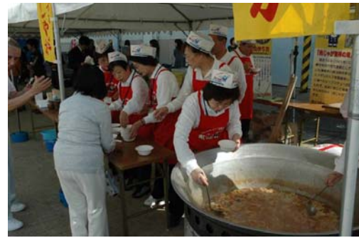
舞鶴発祥「肉じゃが」のふるまい