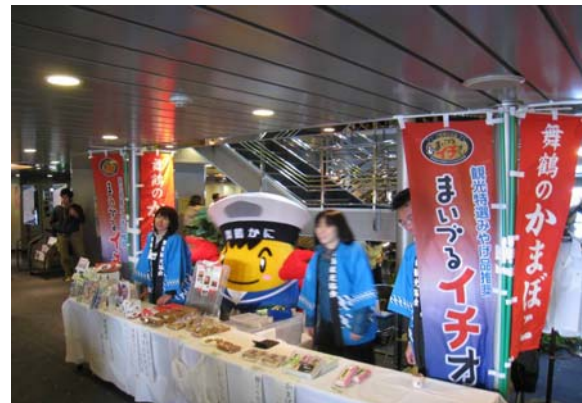
船内での丹後・舞鶴の特産品試食販売