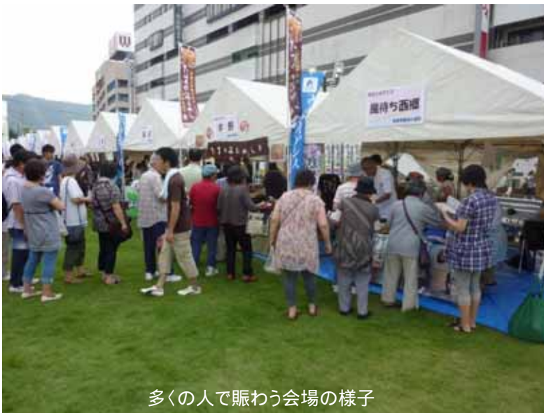
多くの人で賑わう会場の様子

残念ながら3位以内に入賞することはできませんでしたが、賑わいづくりに貢献できたのではないかと思います。第2回については、さまざまな港から引き合いがあるようですが、東北地方で開催できれば東北のみならず復興への一助となるのではないかと思います。