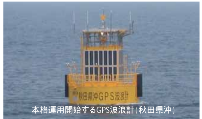
本格運用開始するGPS波浪計(秋田県沖)

なお、本波浪観測網にて観測した沖合での波高については国土交通省港湾局にて公開している「リアルタイムナウファス」(URL: http://www.mlit.go.jp/kowan/nowphas/ )にて直近7日分の波浪観測結果が閲覧可能です。