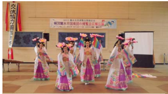
麗水世界博覧会 佐賀県庁でPR

今回の博覧会に向けて、今年7月、両市長によって「世界博支援の共同宣言」が調印され、約三か月の期間中には、EXPO会場において唐津市がシティプロモーションを展開するほか、唐津港から博覧会会場（麗水港）への直行便運航の計画もあります。