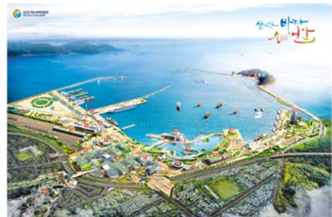
麗水世界博覧会 鳥瞰図

テーマは「生きている海と沿岸：資源の多様性と持続可能な活動」、麗水市の海岸沿い約25ヘクタールの会場敷地に、Big-O、国際館、海洋生物館などが建設され、専用の国際客船ターミナルと大棧橋を備えます。