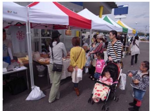
売り切れ続出の海辺カフェ

倉庫は昨年6月に唐津市が寄贈を受けたもので、市民協働による海辺のにぎわい創出を目指す唐津みなとまちづくり懇話会が活用方法の検討を進めていました。