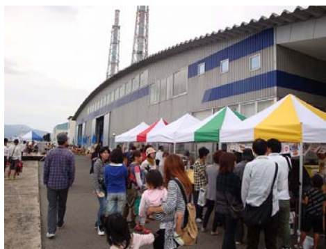
二タ子三丁目倉庫外観の風景