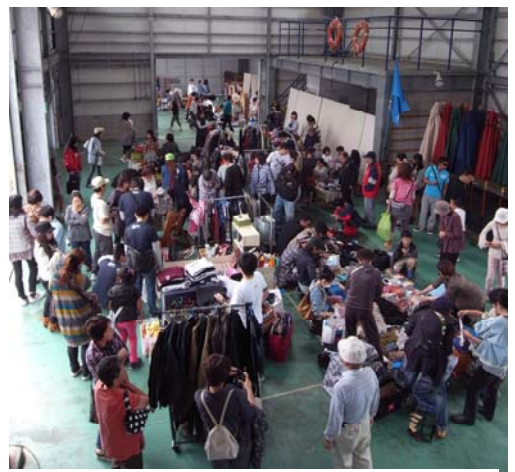
倉庫で開催されたフリーマーケットの様子

フリーマーケットでは、洋服や雑貨などの掘り出し物を狙って開店前から物色が始まり、10時の開店と同時に値段交渉がスタート。あっという間に、