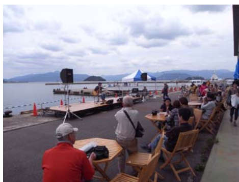
海辺カフェと音楽ライブでひととき