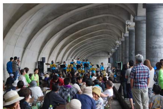
□ 地元高校吹奏楽の演奏