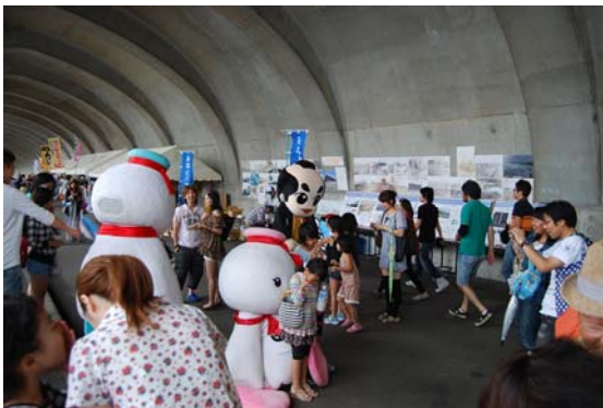
□ 子供たちに大人気のりんぞうくん