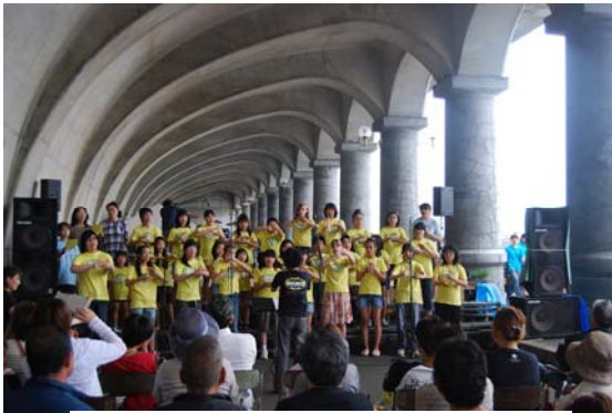
□ ドームの中に響き渡る歌声