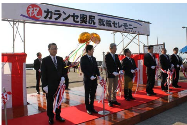
新造船「カランセ奥尻」の就航を祝うセレモニー