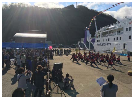
ウェルカムイベントの様子