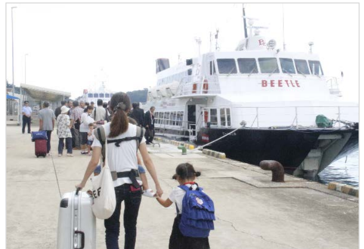
平成30年7月混乗便(比田勝港⇔博多港)運航