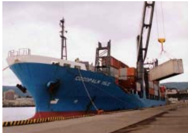
ココパーム・アイル号 11,244ト

小樽港が中国の大連、青島、上海とコンテナ航路で結ばれたことは、新潟・舞鶴と結ばれる国内フェリー航路、サハリン州ホルムスクと結ばれる日口定期フェリー航路と合わせて、更に日本海を中心とした海上交通ネットワークの充実がはかられ、今後ますます港の活用がはかられることとなります。