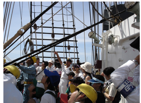
多くの人でにぎわう体験乗船