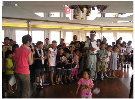
マリエラでのクイズ大会

この「海フェスタふくおか」は、市民のみなさんを始めとして多くの方々に海・船・港の魅力に触れて頂いた9日間だったと思います。