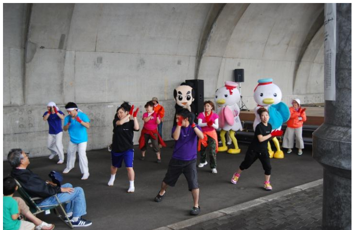
参加者と一緒に踊る「りんぞうくん」と「ぼーとん&べいくりん」