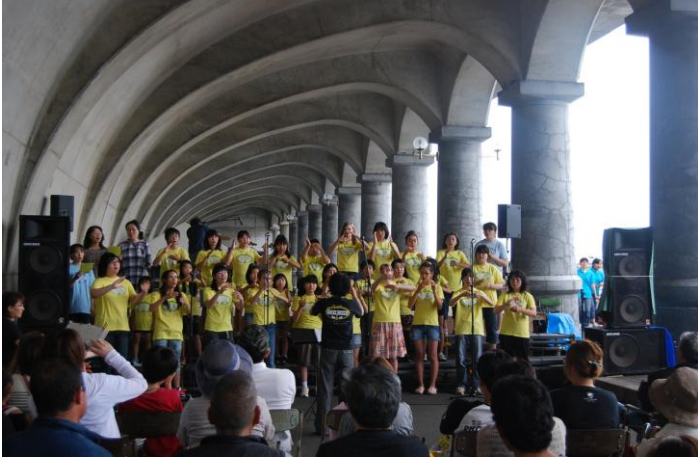
エンジェルボイスによる歌声披露