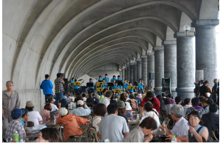
地元高校の吹奏楽部による演奏