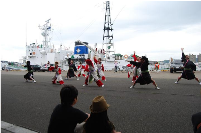
最北烈風隊の演舞