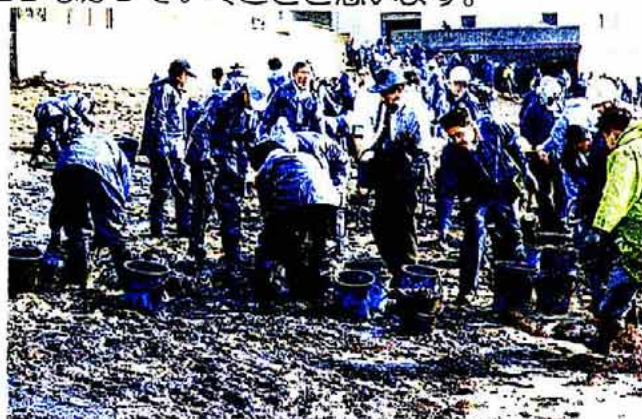
油除去作業(ボランティア活動)