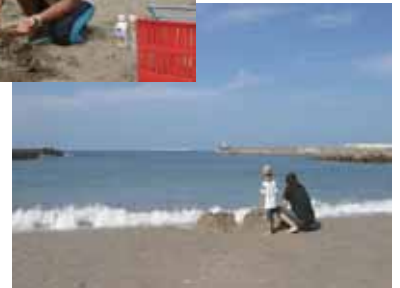
親子でのんびりビーチライフ