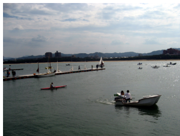
佐賀県ヨットハーバー