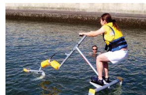
アクアスキッパー