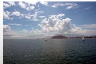
「唐津城を望み走るヨット」