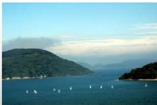
「ヨットと唐津の海」