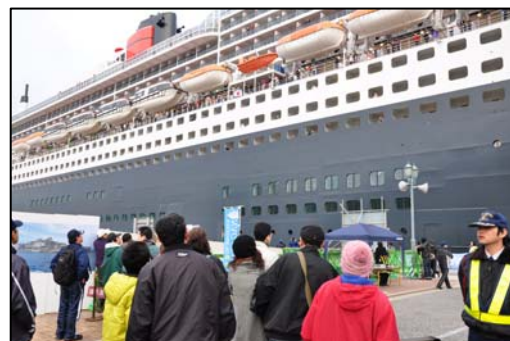
〔見物客でにぎわう松が枝埠頭〕