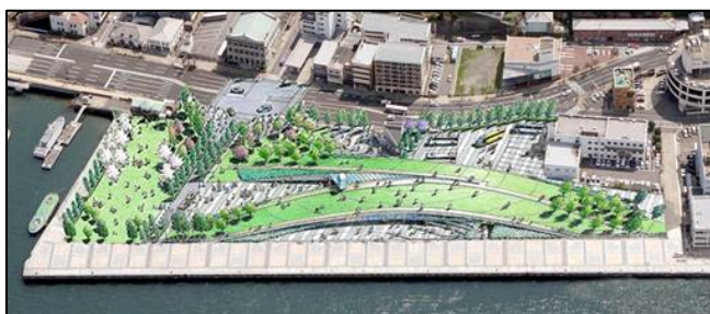
〔松が枝国際観光船ふ頭の完成イメージ〕

3月末には、新しい国際ターミナルビルが完成、来年春には、松が枝国際観光船ふ頭の緑地全体が完成し、国際ゲートウェイ機能の強化が図られます。