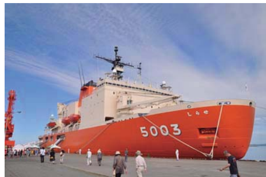
新砕氷艦「しらせ」接岸状況

新砕氷艦「しらせ」が稚内に寄港する本年は、南極探検を日本人で初めて行った年から100年という節目の年でもありましたので、南極探検100周年記念事業と題し、新砕氷艦「しらせ」の一般公開を始め、南極映画祭や南極観測展など南極に関する様々な事業を