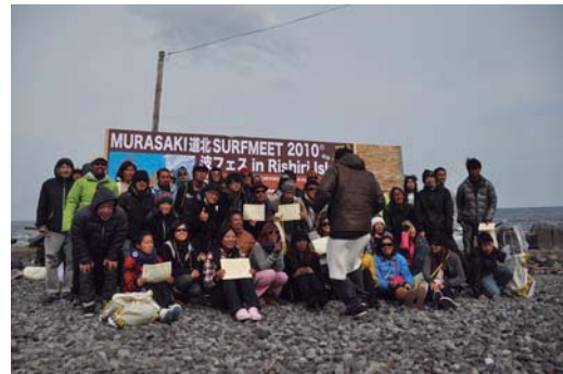
全員そろってハイポーズ！

利尻島は漁業と観光の島ですが、今後サーフィンを通じた活動により地域活性化が図られ、利尻の海が「風の良い日」は漁船漁業で活気のある海に、「波の良い日」はサーファーで賑やかな海になる事で、新たな利尻島観光やまちづくりの可能性を感じる事が出来た一日でした。