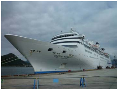
ぱしふいっくびいなす入港

平成23年7月2日(土)から7月4日(月)にかけ、ぱしふいっくびいなす(総トン数26,594トン、旅客定員644名)により京都舞鶴港発着となる「夏の佐渡島クルーズ」が行われました。