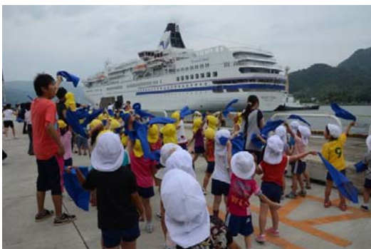
入港セレモニー(園児による出迎え)

7月2日(土)、曇空の中、京都舞鶴港 前島ふ頭に着岸した「ぱしふいっくびいなす」が、午後5時、旅人320名を乗せ、佐渡島へ。