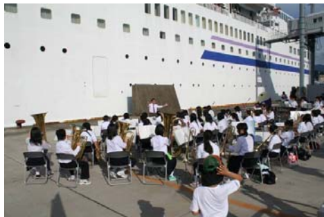
出航セレモニー(吹奏学部演奏)