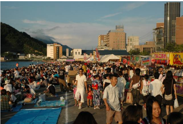
臨港地区のにぎわい

平成23年7月30日(土)、31日(日) 第36回みなと舞鶴ちゃったまつりを開催!