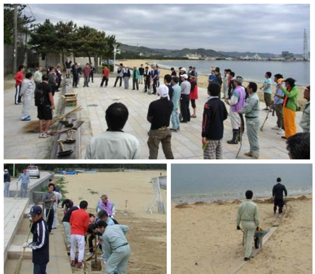
一冬かけて積もった砂をみんなで除去しました