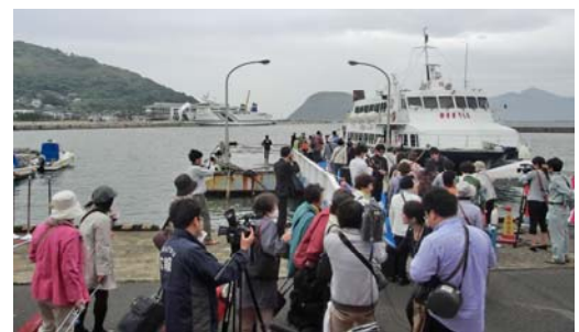
唐津港からビートルに乗って海外へ