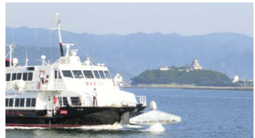
ビートルを唐津城がお迎え

みなさんも、唐津港から高速船BEETLE直行便に乗って麗水世界博覧会へ行ってみませんか。