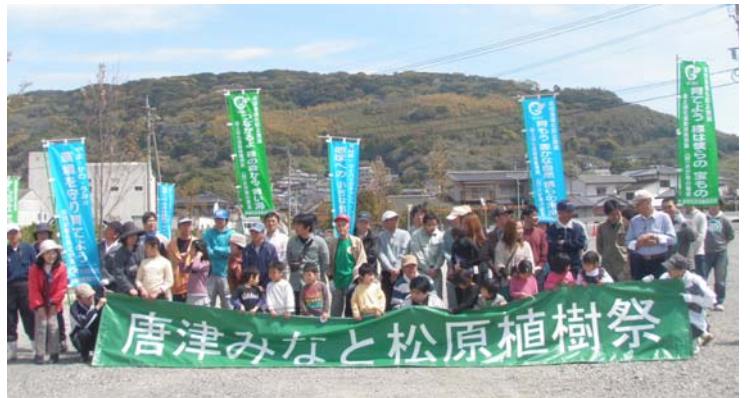
参加者による集合写真

また、植樹際の後には地元の大島保育園児による大島太鼓の披露もあり、当日は大変賑わいました。