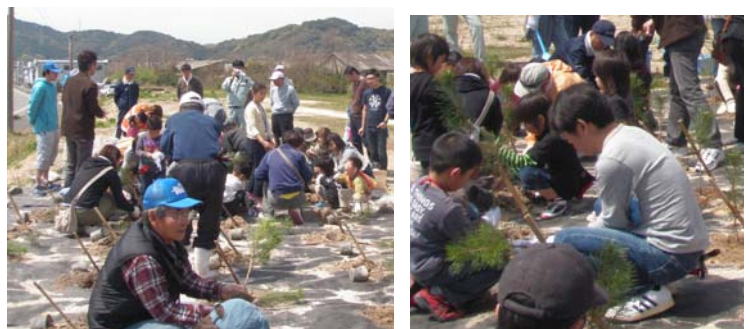
1本1本丁寧に植樹しました！！