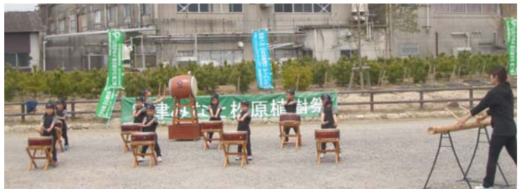
地元大島保育園児による大島太鼓の披露