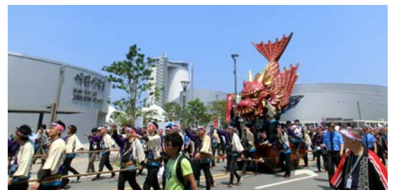
7番曳山 唐津市新町「飛龍」