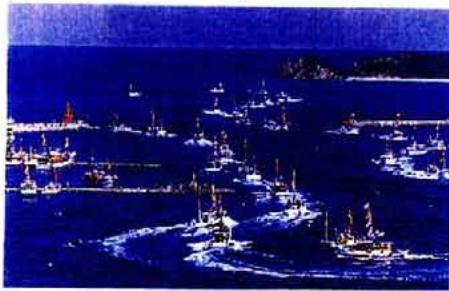
「勝本港まつり」の様子

漁船600隻を有する勝本港での大漁旗で満船色に彩られた漁船の海上パレードは勇壮。