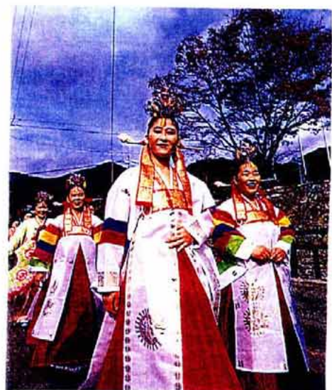
「対馬アリラン祭り」の様子

内容的には時代を反映し、変遷を重ねてきたものの仮装行列、花火大会、郷土芸能あるいは民俗・