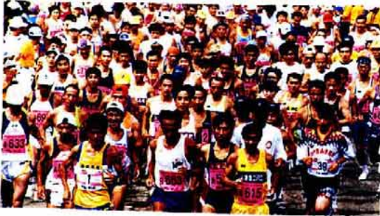
「国境マラソン in 対馬」の様子

「日本の渚百選」である三宇田浜をメイン会場に開催される、「国境マラソン大会 in 対馬」は今年で第三回目を迎えます。町が出資した第三セクター会社「対馬国際ライン」の旅客船で、毎年、韓国からもランナーが参加するなど、国際色豊かな大会となっており、サザエ・イカなどの海産物や、名物の焼き肉などのサービスは、参加したランナーにも大好評です。