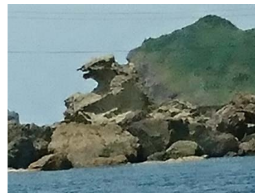
遊覧船から見える「ゴジラ岩」