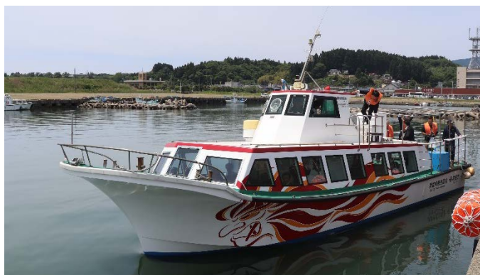
船川港を起点に就航する観光遊覧船「シーバード」