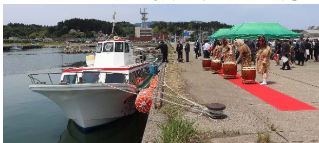
ナマハゲ太鼓に送られる「シーバード」