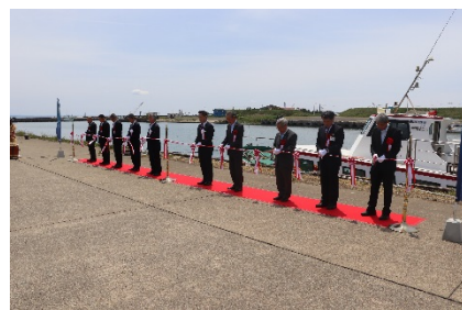
テープカットで就航を祝う関係者