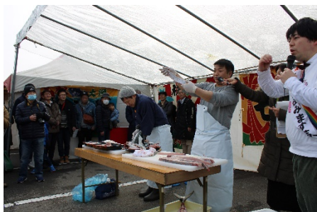
寒ぶりの解体ショー

あり身が引き締まっていて絶品です。イベント当日は地元の宇出津港で水揚げされた寒ぶりをはじめ、様々な魚介類や特産品が宇出津港直送鮮魚市において販売されました。また、寒ぶりの解体ショーも実施され、解体されたぶりはお刺身にして来場者に振る舞われ、沢山の方々が冬の味覚を堪能されていました。その他にも会場では新鮮な魚介類を使用したぶり料理や能登丼、お寿司など様々な料理を出品したブースが設けられ大変にぎわいました。皆様も能登町にお越いただき、おいしい日本海の幸を楽しみませんか。