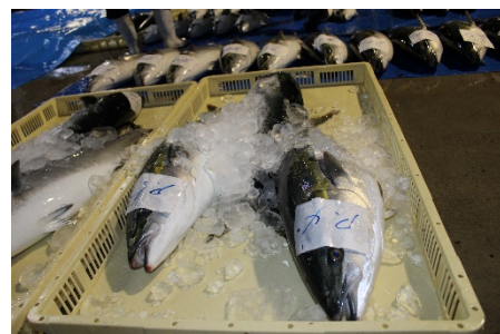
水揚げされたのと寒ぶり