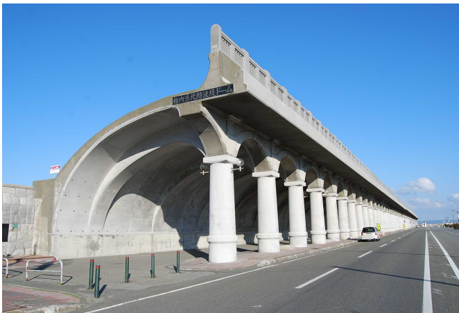
稚内港北防波堤ドーム

日本海側のにぎわい創出・連携においてはなかなか思うような活動が出来ないところではございますが、引き続きご協力よろしくをお願いいたします。