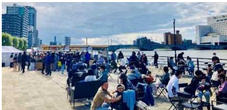
萬代橋と信濃川を望む気持ちいい空間