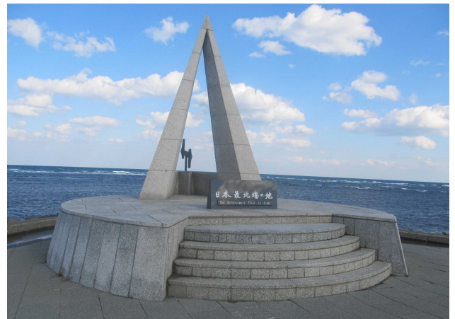
宗谷岬 日本最北端の地の碑