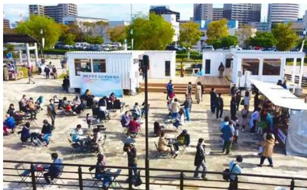
たくさんの方でにぎわう 万代テラス「ハジマリヒロバ」