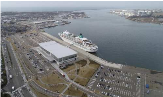
クルーズ船着岸の様子

諸元：総トン数 29,008ト、全長 192.8m、全幅 24.7m、喫水 6.6m、乗客定員 618名 寄港時の乗客数：約500名 ツアー寄港地：（3/1清水※ - ）3/3,4東京 - 3/5名古屋 - 3/6,7大阪 - 3/8広島 - 3/10金沢 - 3/11新潟 - 3/13,14東草 - 3/15釜山 - 3/16濟州 - 3/17長崎 - 3/18鹿児島 - 3/20那覇 - 3/23マニラ ※国内初寄港