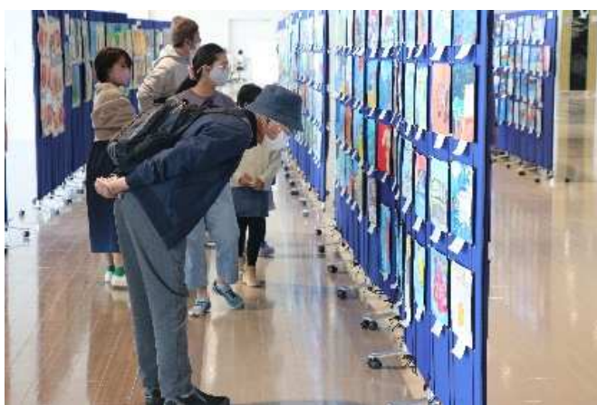
スケッチ作品展示の様子