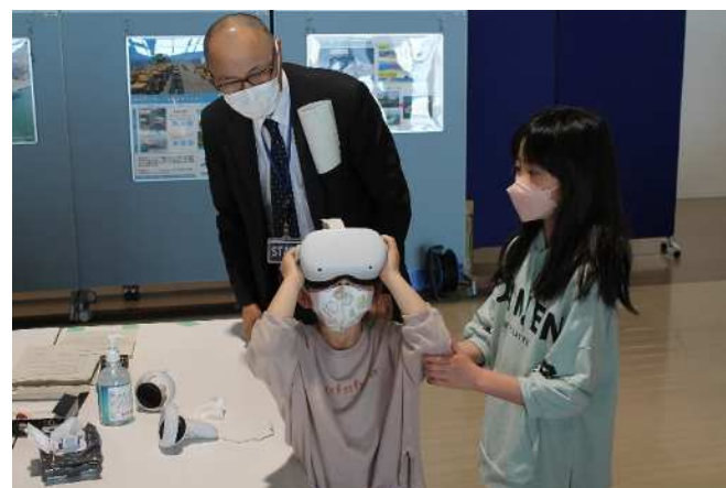
金沢港湾・空港整備事務所によるVR体験コーナー