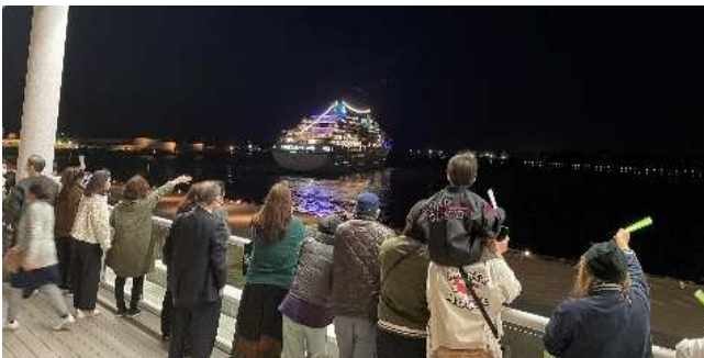
出港時の2F展望デッキの状況