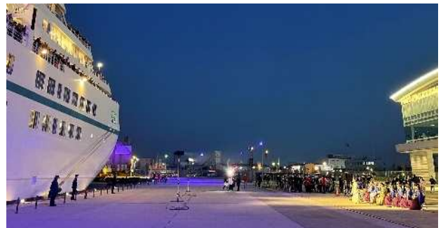
ライトアップされた無量寺埠頭での出港イベント