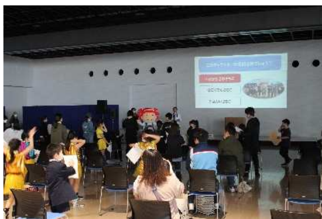
みなとクイズ大会の様子