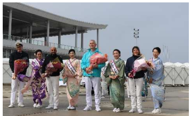
入港後の歓迎式典の様子（花束贈呈）