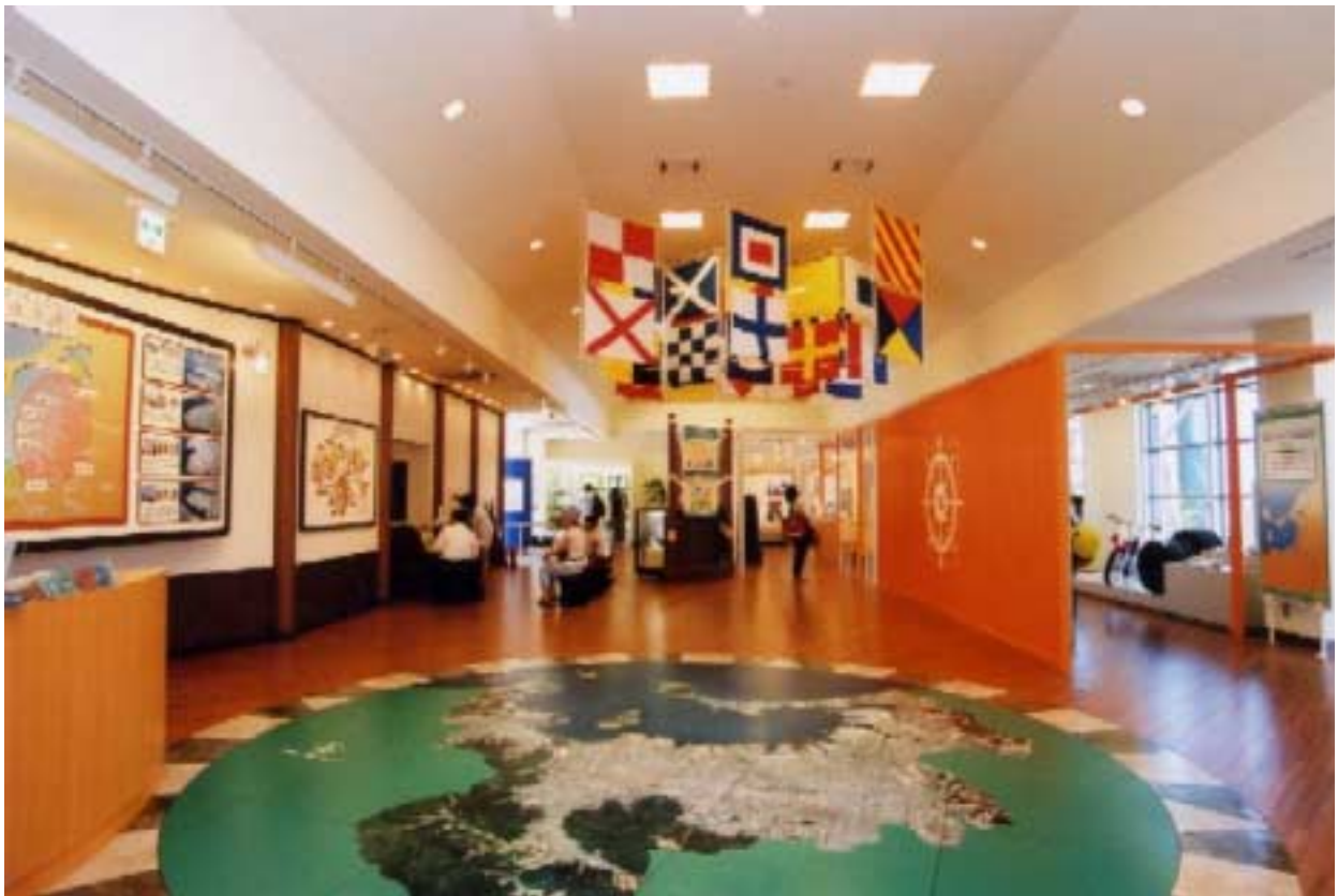
博多港ベイサイドミュージアム

どのように船がつくられるのか、海の上でどうやって自分の位置を知るのか、など船に関する豆知識をお教えします。レーダーや羅針盤、船の国際信号旗の展示、伝声管や船のロープの結び方を体験できるコーナーもあります。