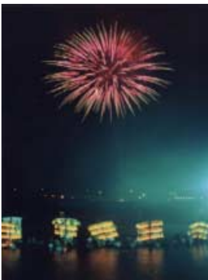
精霊流しと花火大会