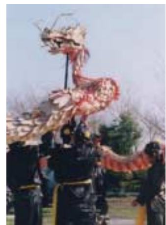
御厨宮日の蛇踊り