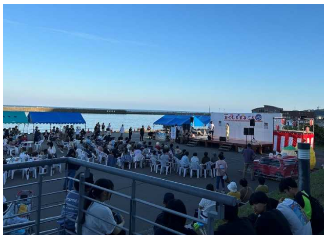
奥尻港特設会場の状況

このお祭りは、長年行ってきた奥尻三大祭を廃止し、昨年度より名称を変えて開催しているもので、島の味覚や産業を堪能でき、来場者参加型の企画もある島内最大のイベントです。老若男女、島民、観光客など誰もが楽しめるプログラムが盛りだくさんに行われ、大いに盛り上がりました。