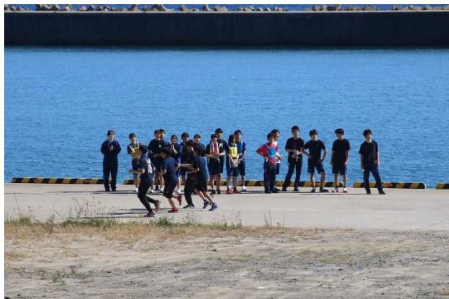
奥尻港内を走る生徒

第33回奥尻町町民体育祭マラソン大会が10月4日（土）に開催されました。幼稚園児と保護者によるペアマラソンから競技がはじまり、児童・学生・一般の計180名が参加しました。選手達は沿道につめかけた観衆からの大きな声援を受け、ゴールを目指し力走しました。