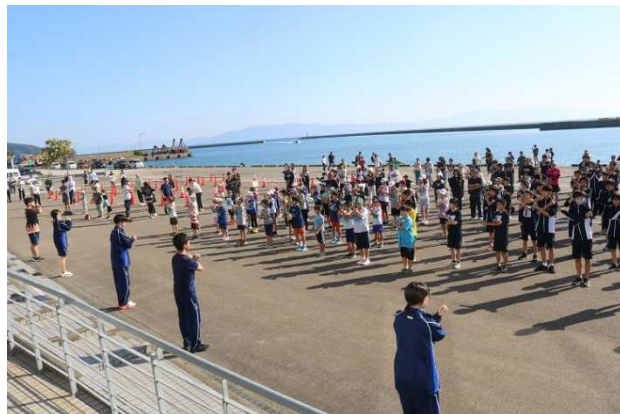
奥尻港内における準備運動の状況