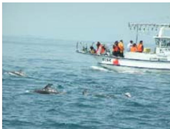
写真2 イルカウォッチングクルーズ

写真2は、今年のゴールデンウィークを中心に運航されたイルカウォッチングクルーズです。2年前、柏崎港では全国都市再生モデル調査事業に採択され5つのにぎわい実験が検証されましたが、このなかから生まれたものです。主催者グループは、これからも継続して、春の新しい観光の目玉にしようと張り切っています。