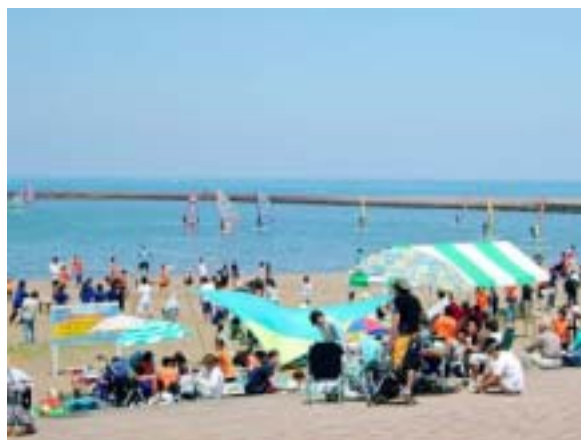
写真1 ウインドサーフィン大会レースを観る観客