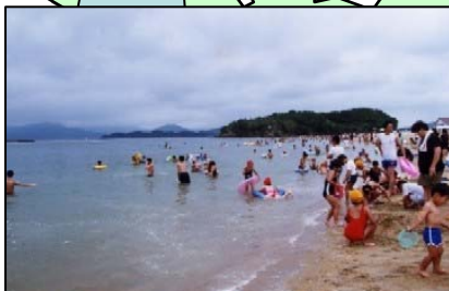
名前:イマリンビーチ 場所:伊万里市黒川町福田