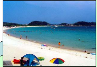
名前:筒城浜海水浴場 場所:長崎県壱岐市石田町筒城仲触