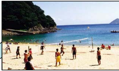
名前:美津島町海水浴場 場所:長崎県対馬市美津島町鶏知