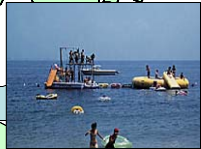
名前:能古島海水浴場 場所:福岡市西区能古島大泊