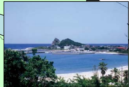
名前:芥屋海水浴場 場所:福岡県糸島郡志摩町芥屋