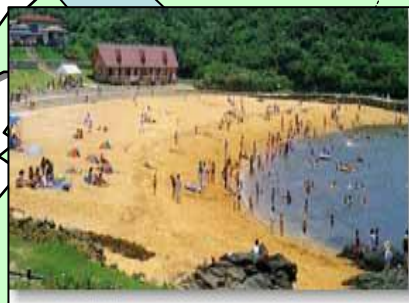
名前:波戸岬海水浴場 場所:佐賀県唐津市鎮西町波戸