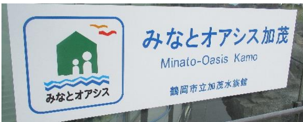
▲代表施設「鶴岡市立加茂水族館」