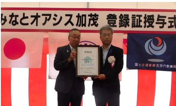
▲「みなとオアシス加茂」登録証の交付