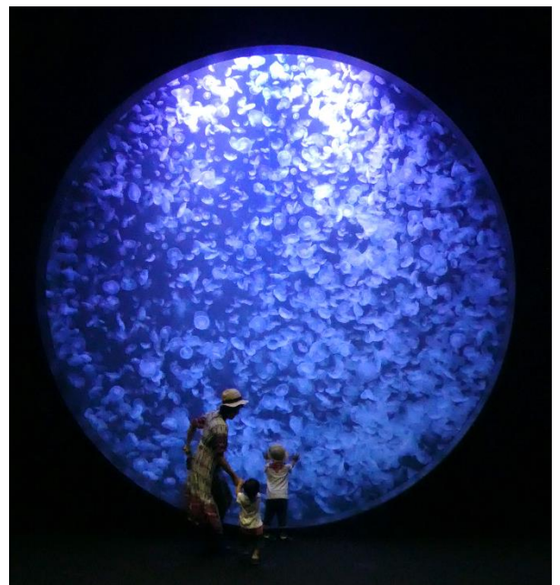
▲代表施設「鶴岡市立加茂水族館」クラゲドリームシアター