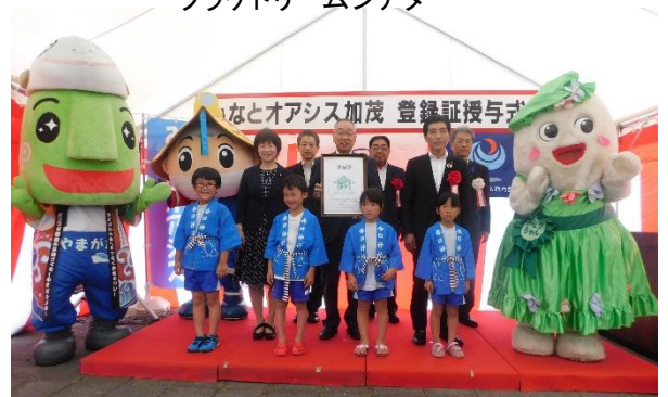
▲地元の小学生と写真撮影