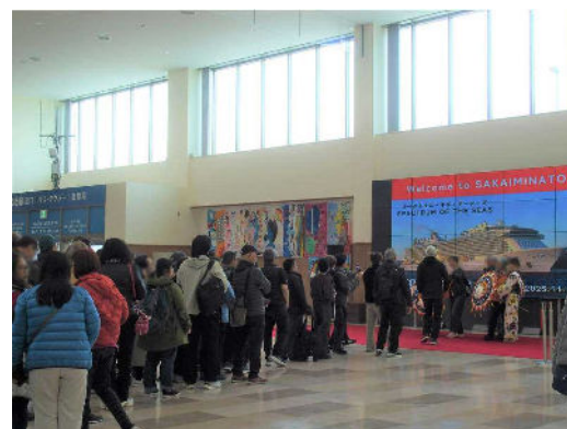
境夢みなとターミナル内の様子