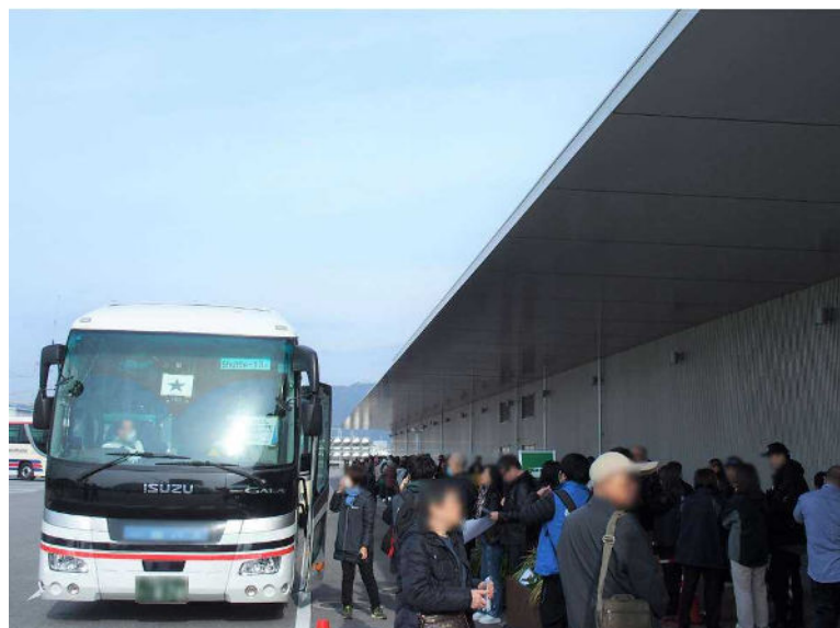
境夢みなとターミナルから山陰地方の観光地へ向かう様子