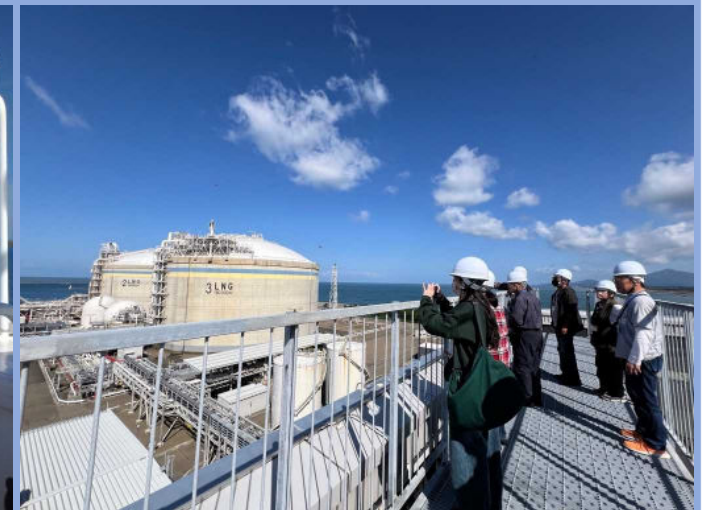
(株)JERA火力発電所見学