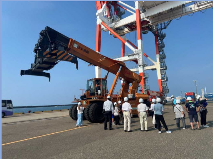
ガントリークレーン見学