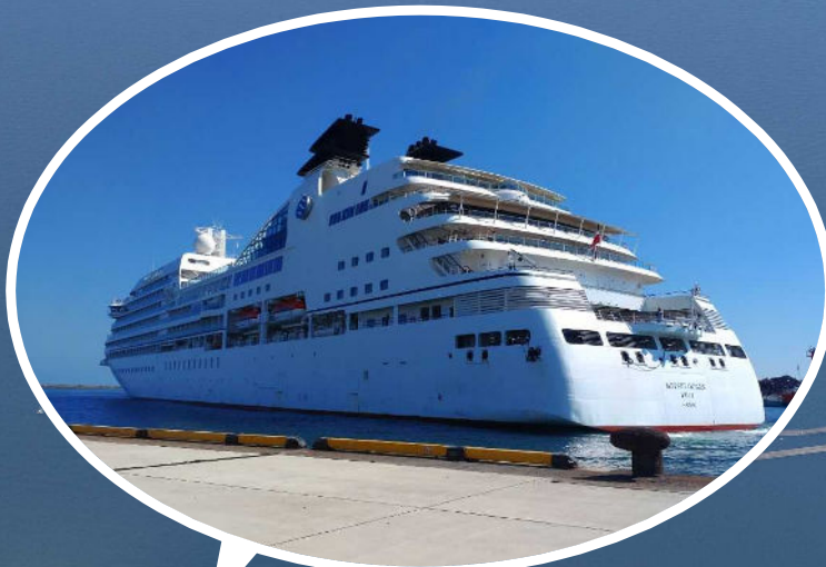
クルーズ客船寄港