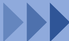
【事後学習】VR動画を活用