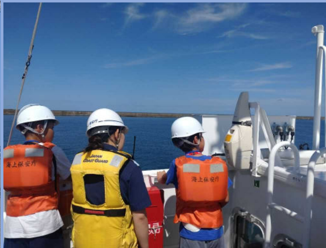
巡視艇たつぎり体験航海