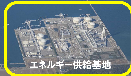
エネルギー供給基地