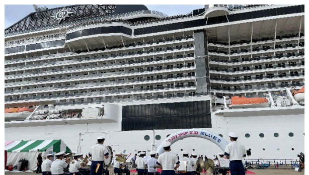
消防音楽隊の演奏でお見送り(富山)