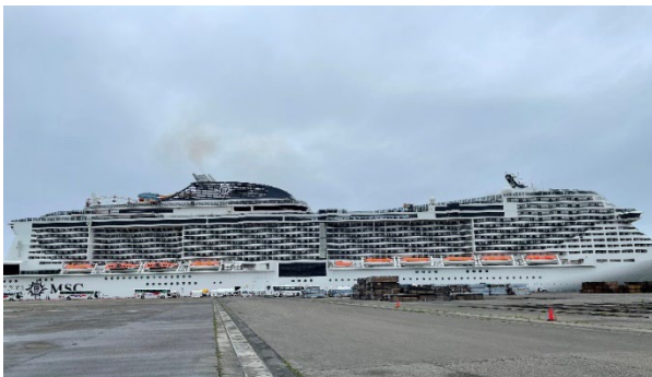
新潟港東港区に入港