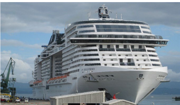
伏木富山港(伏木地区)に入港