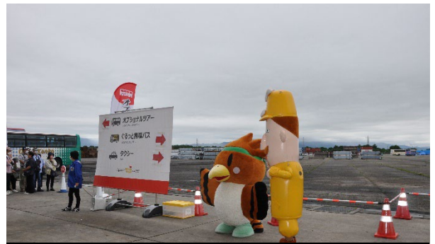
ご当地キャラクターがお出迎え(新潟)