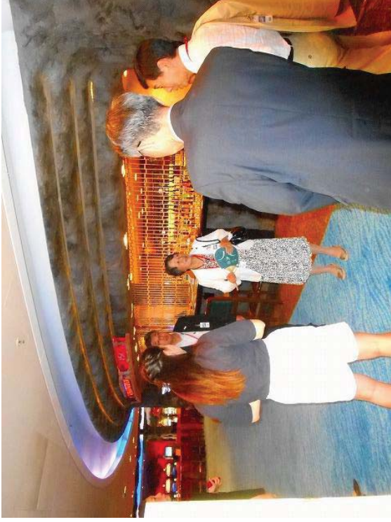
ダイヤモンドプリンセス船内