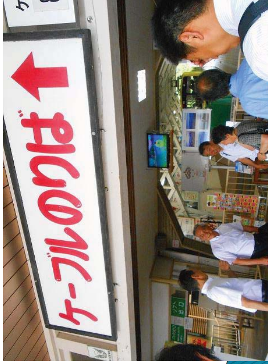
天橋立(ケ-ブルカー)