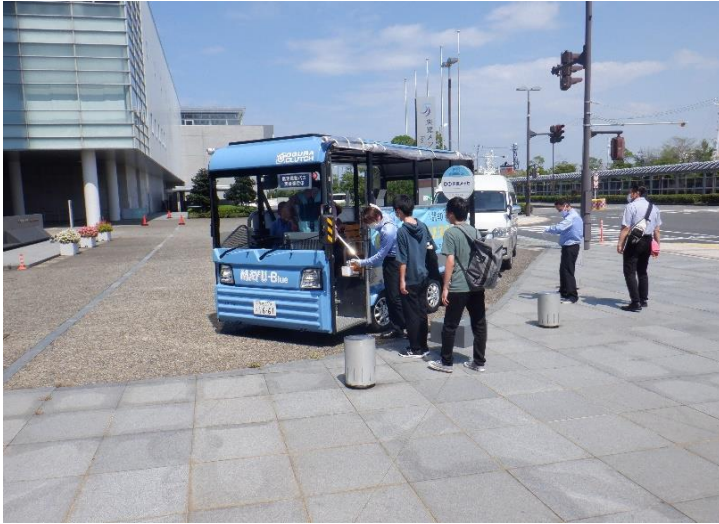
低速電動バスの乗車状況