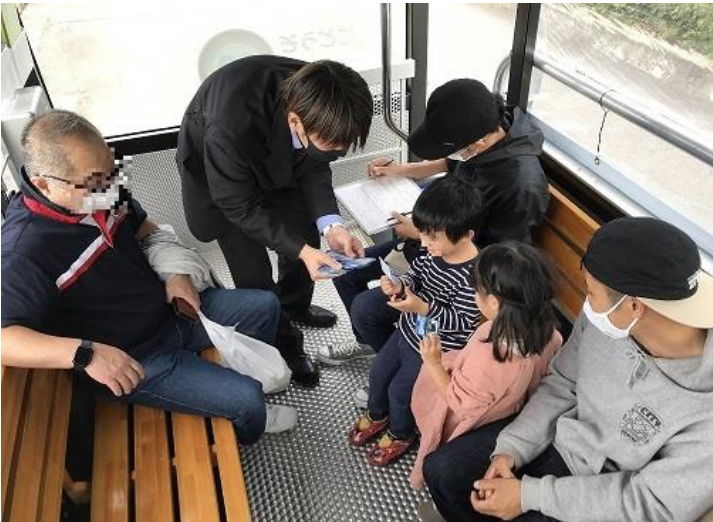
「港カード」の配布状況