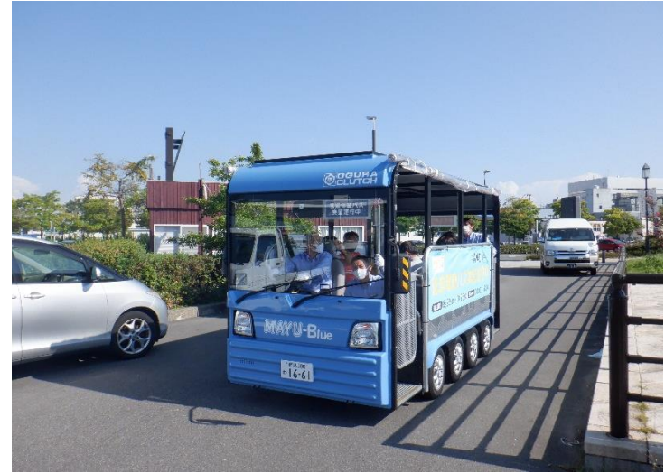
万代テラスを走る低速電動バス