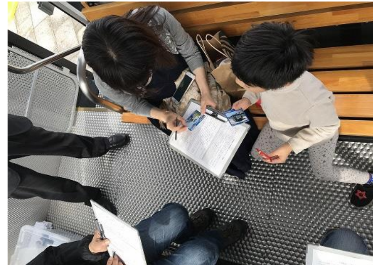
「港カード」の配布状況